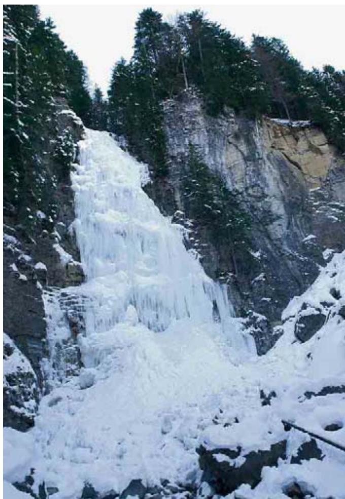
On atteint cette impressionnante cascade de 45 mètres par un chemin forestier.